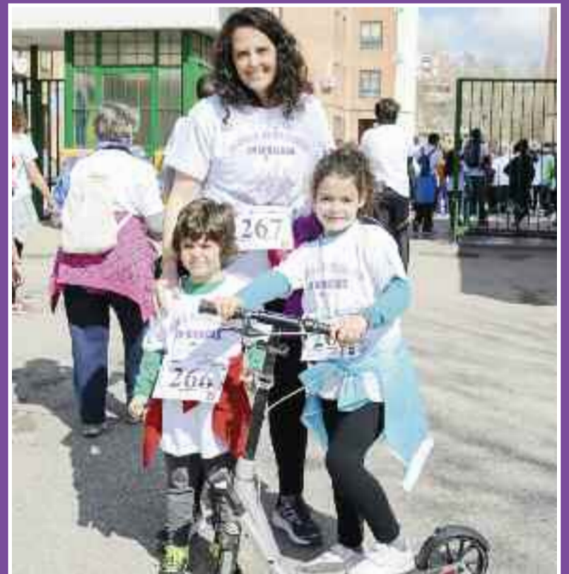
“Una milla por la Igualdad” y las actividades de “Ocio en Igualdad”, previstas para el pasado mes de marzo y que quedaron suspendidas por la previsión de lluvia.